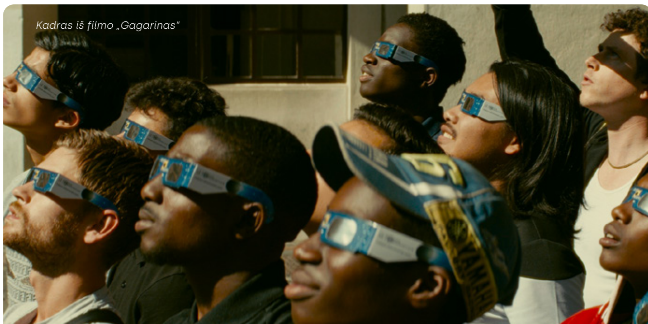
Kadras iš filmo „Gagarinas“